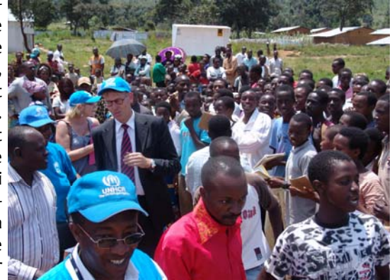
L'Ambassadeur de Belgique avec les réfugiés

pourraient jouer un rôle important dans leur éducation et leur ouverture au monde. « Que ces livres soient pour vous source de plaisir et de découverte », a-t-elle lancé en guise de conclusion.