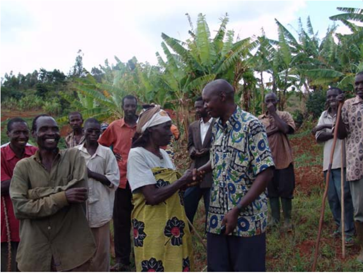
Samvura, Makamba : une femme rapatriée et un résident se serrent la main après une médiation réussie au sujet d'une parcelle disputée.