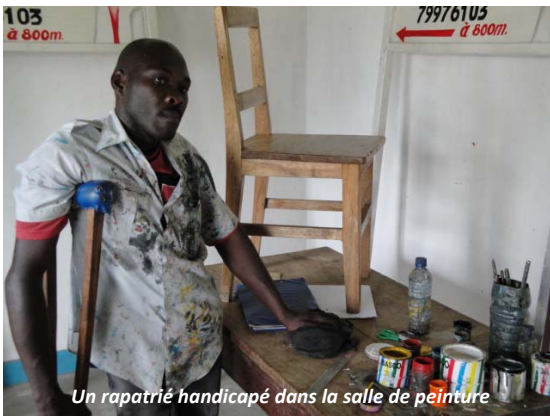
Un rapatrié handicapé dans la salle de peinture

L'association cherche actuellement à mobiliser une somme de six millions de Francs burundais pour mener à bien ce projet d'activités génératrices de revenus qui permettra d'améliorer la vie des rapatriés handicapés dans la commune de Rumonge.