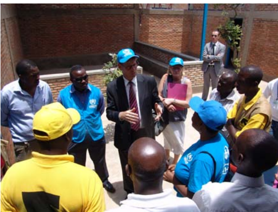
L'Ambassadeur de Belgique dans le nouveau centre SGBV de Bwagiriza

qu'un manque d'activités coordonnées recouvrant tous les besoins des victimes en soins de santé, suivi psychosocial et information légale. En collaboration avec l'UNHCR, l'IRC a préparé un programme de prévention et de renforcement des structures d'accompagnement et d'aide aux victimes. En matière de prévention,