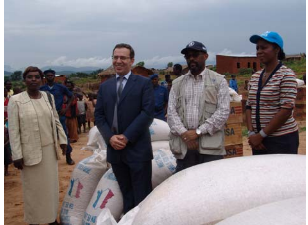
VRI de Mutambara: visite de l'Ambassadeur de France au Burundi, accompagné par la Gouverneur de la Province de Bururi et les Représentants du PAM et de l'UNHCR.