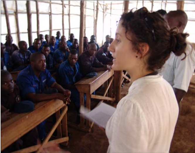
Formation des policiers assurant la sécurité des camps

Nous avons aussi poursuivi les activités de soutien à la réintégration des rapatriés, y compris les cours de mise