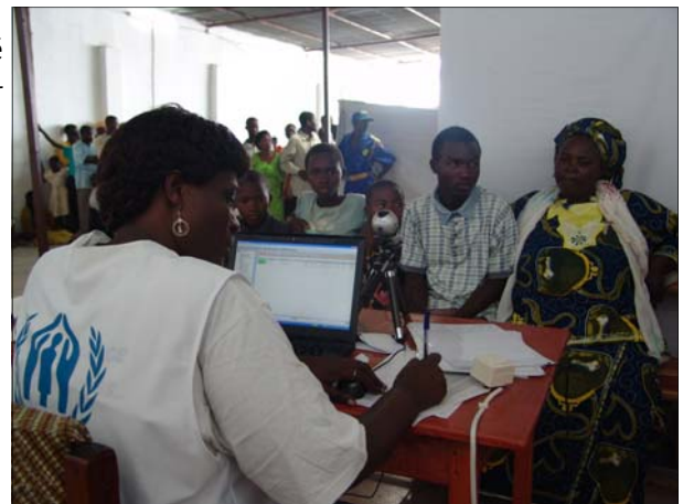
Enregistrement des réfugiés

Q : Quel a été le plus grand défi auquel à fait face l'UNHCR au cours de