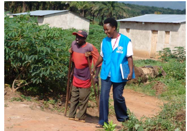
Un staff du HCR visite un rapatrié handicapé à Buzimba, en province de Bururi. Les rapatriés handicapés ont besoin d'un accompagnement afin d'assurer leur réintégration effective.