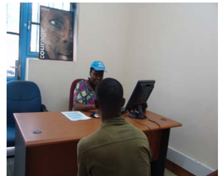
Un réfugié urbain reçu au HCR à Bujumbura

Des équipements et du matériel audiovisuel sont prévus pour les personnes non alphabétisées ou ayant une limitation auditive, et bien d'autres facilités seront aménagées pour l'efficacité du Centre. Suivant la bonne marche du projet, des formations seront dispensées sur différentes thématiques, des réunions et autres activités sociales ou culturelles pourront y être organisées. La mise en place du CUCOR est encore en phase de préparation et prévoit une petite structure dans un premier temps. Il s'agrandira en fonction des besoins. Le Centre devrait être opérationnel d'ici peu et pourra accueillir les demandeurs d'asile et les réfugiés dans un lieu unique et accessible.