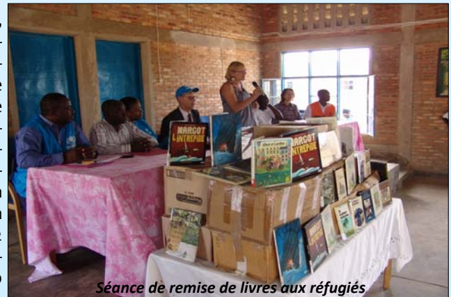
Séance de remise de livres aux réfugiés