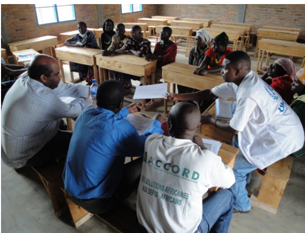
Séance de discussion avec les adolescentes du VRI de Mutambara

Les provinces de Makamba, Bururi et Rutana, couvertes par cette évaluation, ont accueilli depuis 2008 plus de 73 802 rapatriés burundais en provenance de la Tanzanie et de la République Démocratique du Congo. Ce chiffre représente 56 % des rapatriés de retour au Burundi pendant cette période.