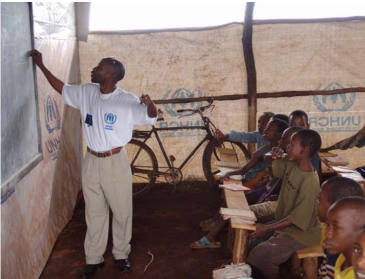
Dans les camps de réfugiés aussi, les enfants ont droit à l'éducation .